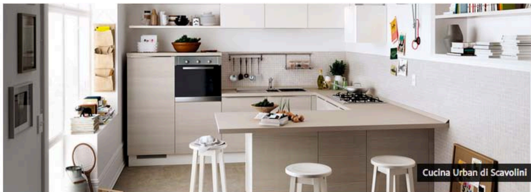
Cucina Urban di Scavolini